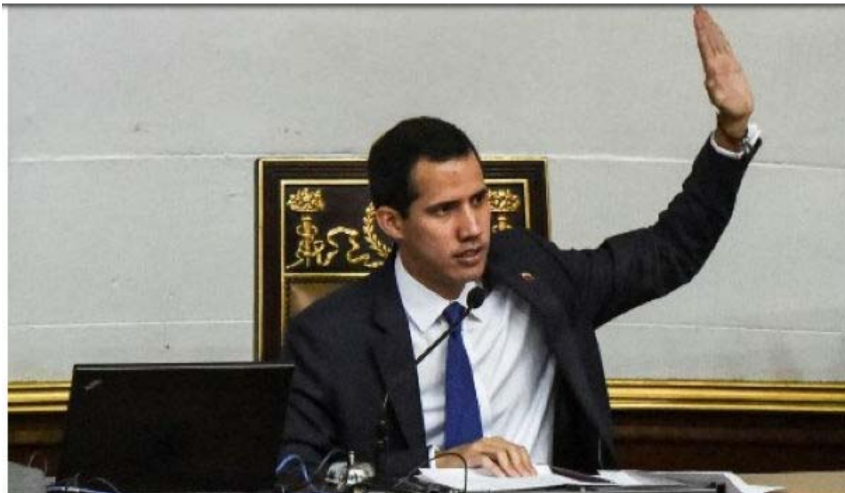
Le président par intérim auto-proclamé Juan Guaidó lors d'une session de l'Assemblée nationale vénézuélienne, le 5 février 2019.

Juan Guaidó est un jeune député depuis janvier 2016, mais c'est le 5 janvier 2019 qu'il se fait élire président de l'Assemblée Nationale, et le 10, il déclare ne plus reconnaître Nicolás Maduro, il s'auto proclame "Président de la République par intérim" et a fait le serment suivant « Je jure d'assumer formellement les compétences de l'exécutif national comme président en exercice du Venezuela pour parvenir (...) à un gouvernement de transition et obtenir des élections libres. »