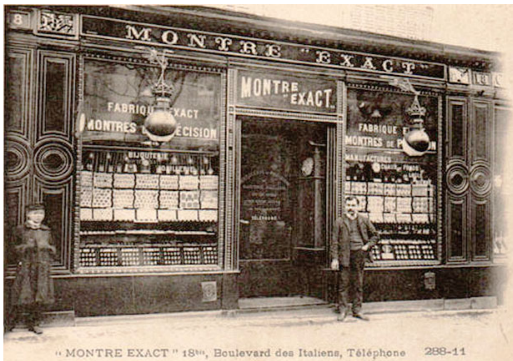
Montre Exact 18bis, Boulevard des Italiens, Paris. La carte postale date des années 1920.