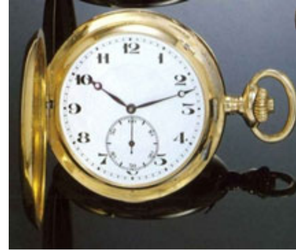
Peu d'exemples de montres ont été retrouvés. Ci-dessous un chronomètre datant des années 1920.

Je n'ai pas retrouvé le lien avec la famille Perusset mais le nom Perusset et Didisheim apparaît souvent dans les ventes de montres.