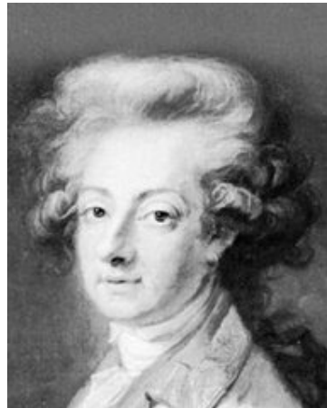
"Une colère de 1800 ans me paraît avoir duré longtemps assez" (1801), Charles-Joseph, Prince de Ligne