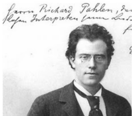
"Je suis trois fois apatride. Comme natif de Bohême en Autriche, comme Autrichien en Allemagne, comme juif dans le monde entier", Gustav Mahler