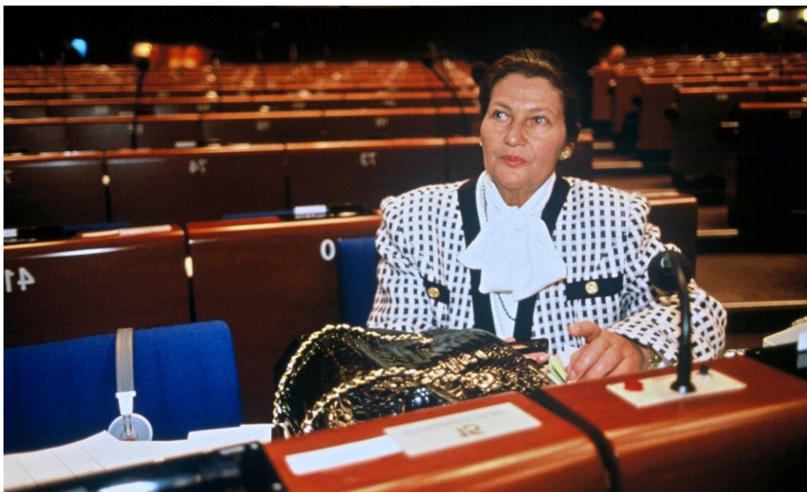
Simone Veil au Parlement européen. 1989. Sipa. Numéro de reportage :