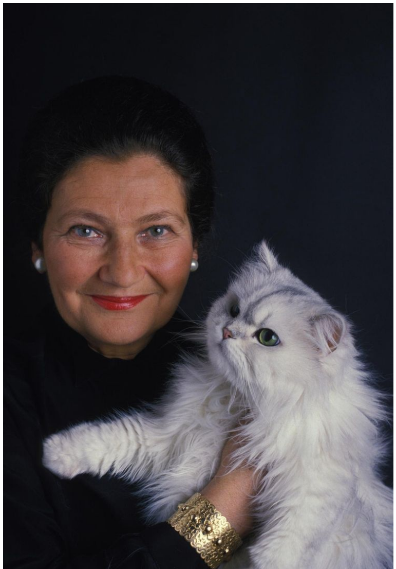
En février 1987, à Paris.

S imone Veil est dans le présent, toujours. Femme exceptionnelle, adorée des Français, à l'image si pure. Simone Veil la déportée, Simone Veil la combattante de l'IVG, Simone Veil l'Européenne. Toujours la même. Un roc. Elle disait encore : « Je crois, toujours, que cela sert à quelque chose de se battre. Et quoi qu'on dise, l'humanité, aujourd'hui, est plus supportable qu'hier. » Et ajoutant : « On me reproche d'être autoritaire. Mais les regrets que j'ai, c'est de ne pas m'être battu assez sur tel ou tel sujet. »