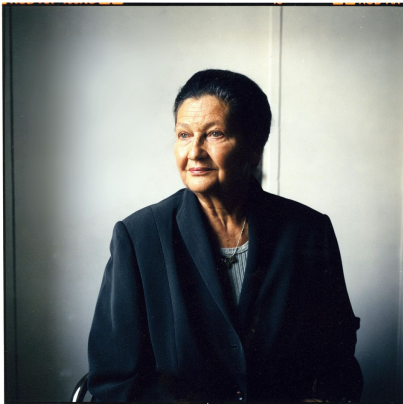
Simone Veil en avril 2005.