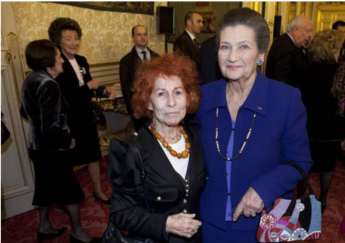
Marceline Loridan-Ivens et Simone Veil