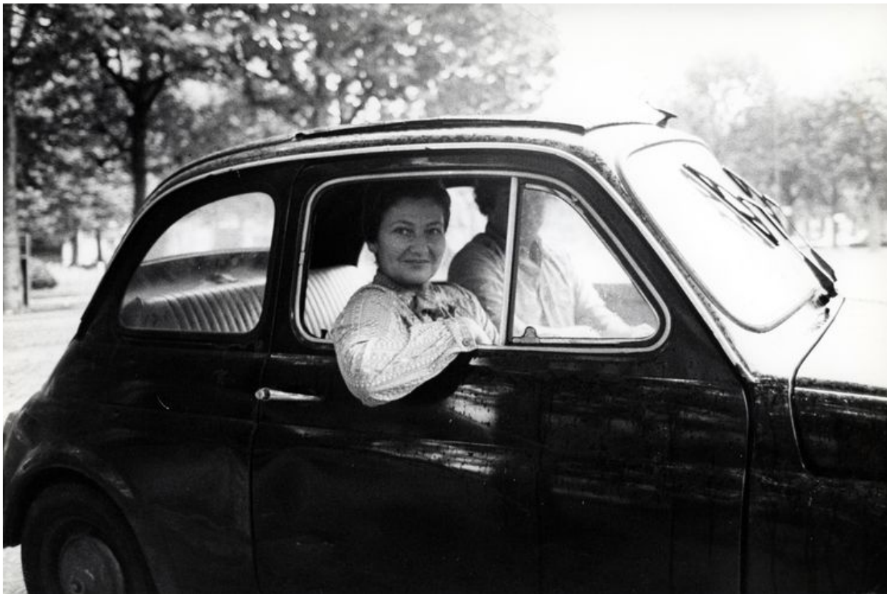
Simone Veil se rend aux urnes en Fiat 500, le 10 Juin 1979.