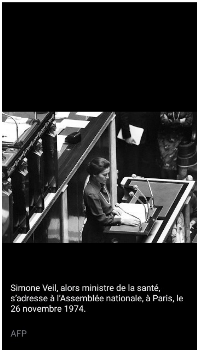
Simone Veil, alors ministre de la santé, s'adresse à l'Assemblée nationale, à Paris, le 26 novembre 1974.