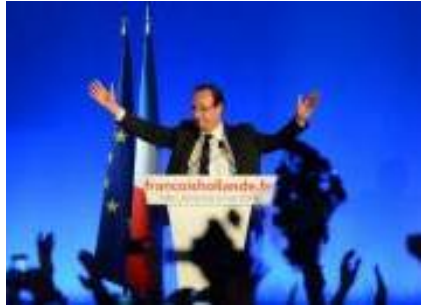
François Hollande président de la République : l'analyse