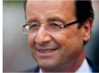
François Hollande : l'agenda chargé du nouveau président