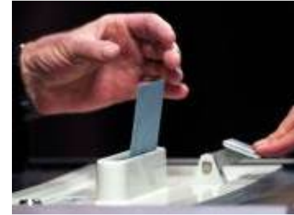
Les catholiques pratiquants toujours plus à droite