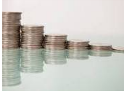
Économie : les vraies urgences, et pourquoi ce